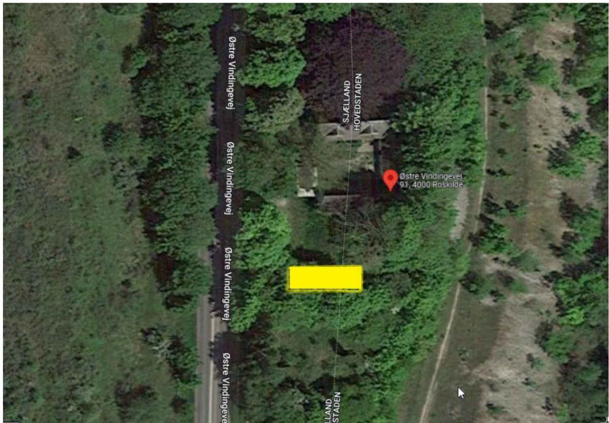
Situationsplan. – Pavillon markeret med gult.